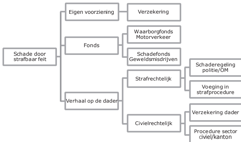
Figuur 1: Routekaart voor schadeverhaal na een strafbaar feit